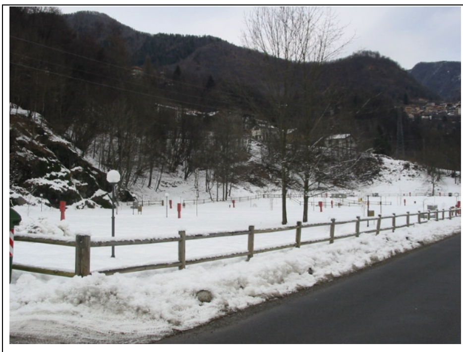
Foto n. 12 Area attrezzata per sosta camper e roulotte lungo la Strada Semiprovinciale Varallo-Fobello, annessa al Bar Trattoria “Piano delle Fate”