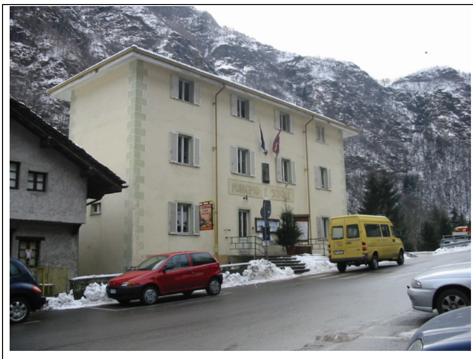
Foto n.1 Sede del Municipio e delle Scuole Elementari in via Centro