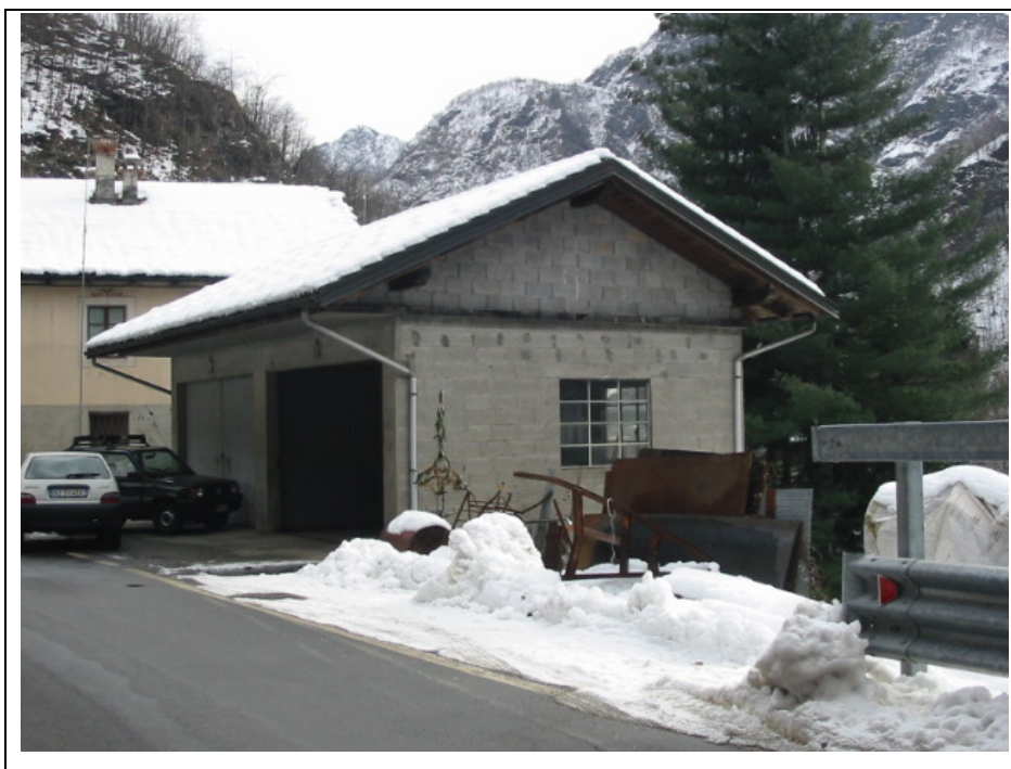
Foto n.15 Attività di fabbro ubicata in Frazione Molino-Bellaria lungo la Strada Semiprovinciale Varallo-Fobello