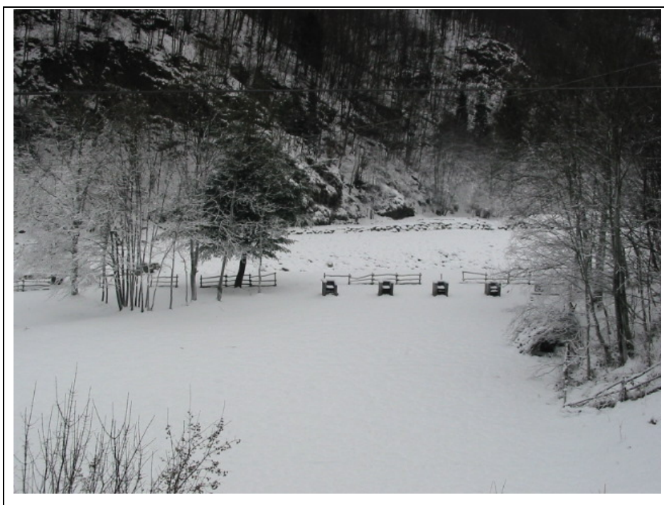
Foto n.14 Area attrezzata per grigliate e pic-nic della “Comunità Montana Valsesia” lungo la Strada Semiprovinciale Varallo-Fobello, nei pressi della frazione Selva