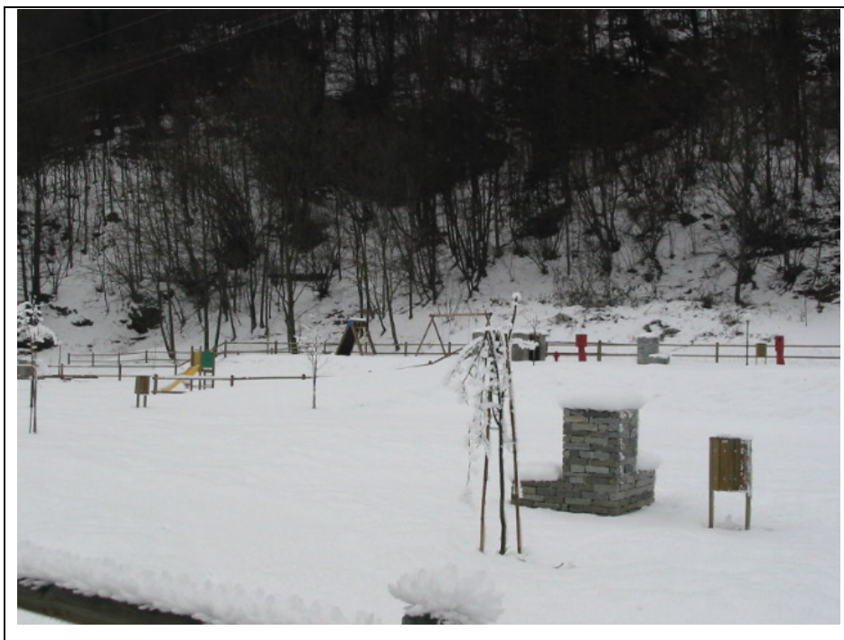
Foto n. 13 Area attrezzata per sosta camper e roulotte lungo la Strada Semiprovinciale Varallo-Fobello, annessa al Bar Trattoria “Piano delle Fate”