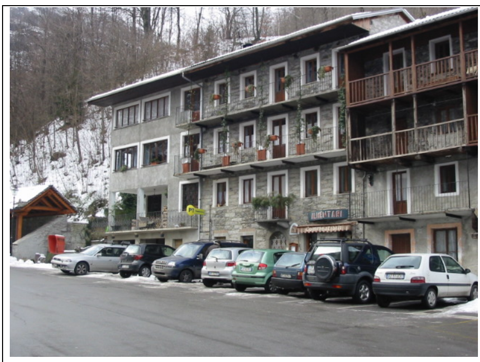
Foto n.2 Parcheggio pubblico, ufficio postale e negozio di alimentari in via Centro