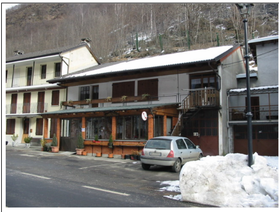
Foto n.16 Bar Ristorante in Frazione Nosuggio lungo la Strada Semiprovinciale Varallo-Fobello