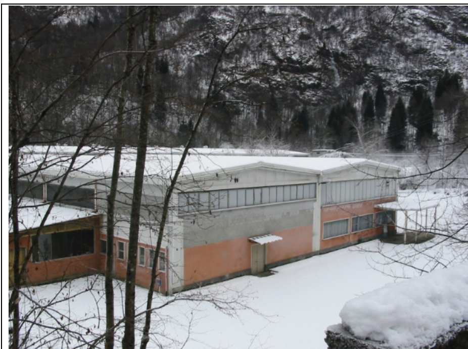
Foto n. 7 Stabilimenti della Ditta “Poli” lungo la Strada Semiprovinciale Varallo-Fobello