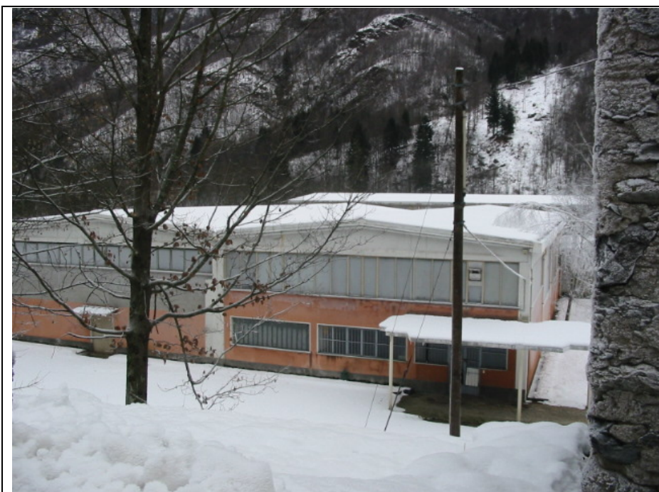
Foto n. 8 Stabilimenti della Ditta “Poli” lungo la Strada Semiprovinciale Varallo-Fobello