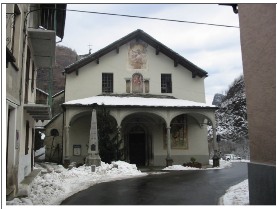
Foto n.4 Chiesa Parrocchiale nel centro di Cravagliana