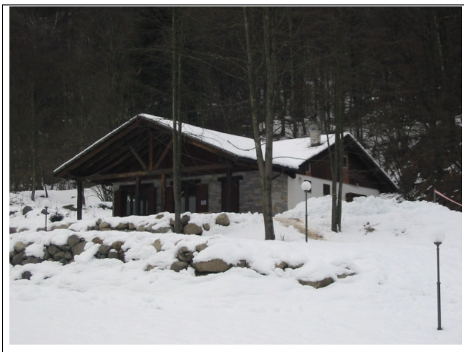
Foto n. 11 Bar Trattoria “Piano delle Fate” lungo la Strada Semiprovinciale Varallo-Fobello