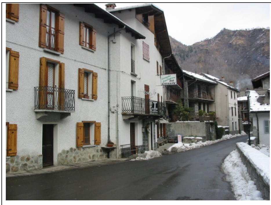
Foto n.3 Bar Ristorante “La locanda del Cacciatore” in via Centro