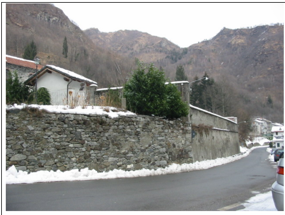
Foto n. 6 Cimitero annesso alla Chiesa Parrocchiale di Cravagliana