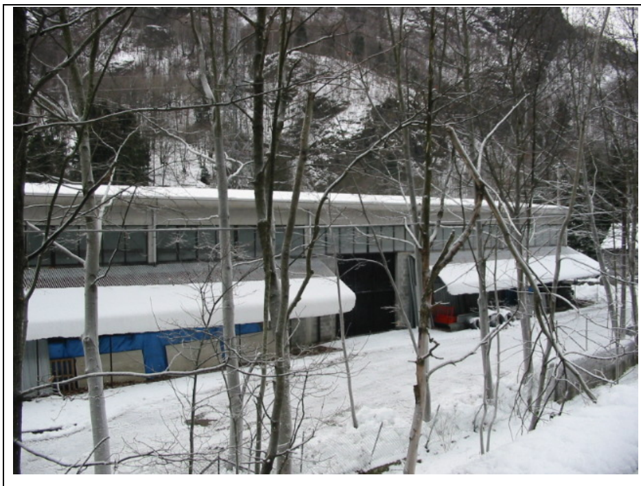
Foto n. 10 Magazzino della Ditta “Poli” lungo la Strada Semiprovinciale Varallo-Fobello