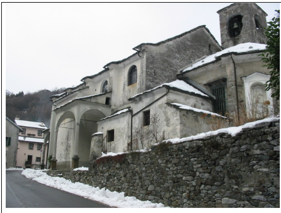
Foto n.5 Chiesa Parrocchiale nel centro di Cravagliana