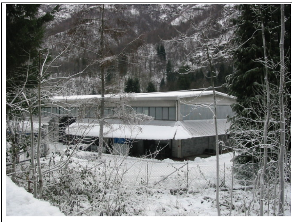
Foto n. 9 Magazzino della Ditta “Poli” lungo la Strada Semiprovinciale Varallo-Fobello